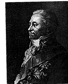
6. Portret Józefa Wybickiego z około 1843 roku, ryt. F. S. Hanfstaengl według obrazu M. Bacciarellego