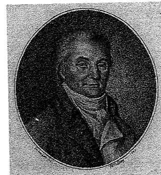
5. Portret Józefa Rufina Wybickiego z 1805 roku, ryt. F. W. Nettling według T. L. Poschmanna